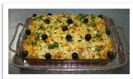
Bacalhau à Gomes Sá 2ª feira, 23 de Setembro