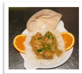
Frango de caril 3ª feira, 24 de Setembro