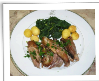
Cabrito assado no forno 2ª feira, 23 de Setembro