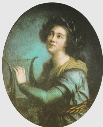
Retrato a óleo por Louise Elisabeth Vigée-Lebrun Paris, 1785