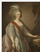
Maria I, Queen of Portugal. Thomas Hickey or Giuseppe Troni (attributed).