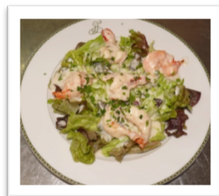
Salada de camarão Diariamente, na carta