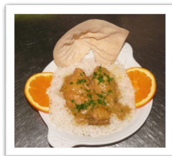
Frango de caril 5ª feira, 2 de Maio