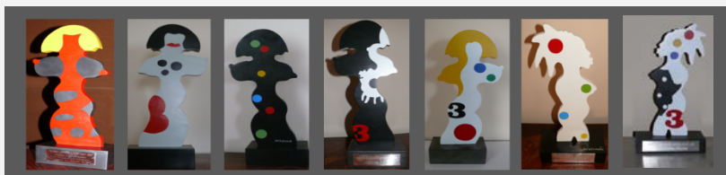
Prémio Grémio Literário Escultura da autoria do Consócio José de Guimarães

Na data do 168º aniversário da aprovação dos Estatutos do Grémio Literário por carta Régia de Dona Maria II, vai realizar-se uma sessão comemorativa, na Biblioteca, durante a qual serão entregues o Prémio Grémio Literário 2013 e as menções honrosas, distinções atribuídas pelo respectivo Júri (Conselho Literário).