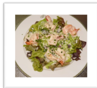
Salada de camarão Diariamente, na carta