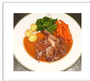
Cabrito assado no forno 2ª feira, 22 de Abril