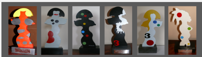
Prémio Grémio Literário Escultura da autoria do Consócio José de Guimarães

Na data do 167º aniversário da aprovação dos Estatutos do Grémio Literário por carta Régia de Dona Maria II, vai realizar-se uma sessão comemorativa, na Biblioteca, durante a qual serão entregues o Prémio Grémio Literário 2012 e as menções honrosas, atribuídas pelo respectivo Júri (Conselho Literário).